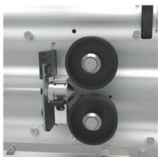
Unità di trasporto intercambiabili: ruote/cinghie

La EcoStrip 9380 è una tagliaspela fili automatica che offre i vantaggi di un utilizzo semplice e razionale. E' una macchina flessibile caratterizzata dalla rapida intercambiabilità dell'unità di trasporto: ruote, cinghie e modalità corta. La EcoStrip 9380 può essere utilizzata stand-alone o in con una varietà di attrezzature pre e post-processo così da avere una linea completamente automatica. Il software di gestione Cayman è disponibile come opzione per un più rapido set-up della macchina.